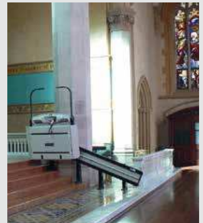
V64 con apertura automatizada