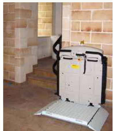
V65 con barras retractiles