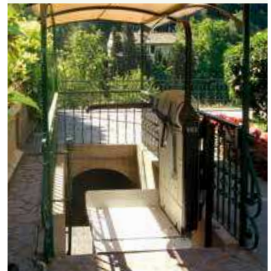
V65 con barras independientes