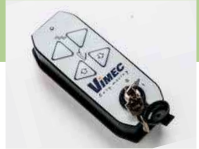
Mando via radio